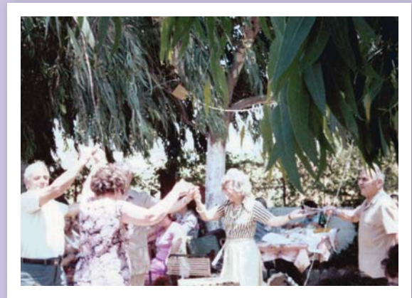
Στιγμιότυπο από παλαιότερη εκδρομή του ΣΠΕΑ