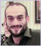
Του Παναγιώτη Καρκάνη

Η πολυαγαπημένη μας γιατρός, μητέρα, προσάτης αθλήτρια και φίλη έφυγε από κοντά μας και πέρασε στην Ιστορία. Το έργο της τεράστιο, το όνομά της πασίγνωστο εδώ αθλήτρια και στο εξωτερικό. Αγαπούσε την επιστήμη της δουλεύοντας σκληρά πολλές ώρες, έχοντας παράλληλα πολλή αγάπη για τον άνθρωπο, συνδυάζοντας τα δύο αυτά χαρακτηριστικά με μοναδικό τρόπο.