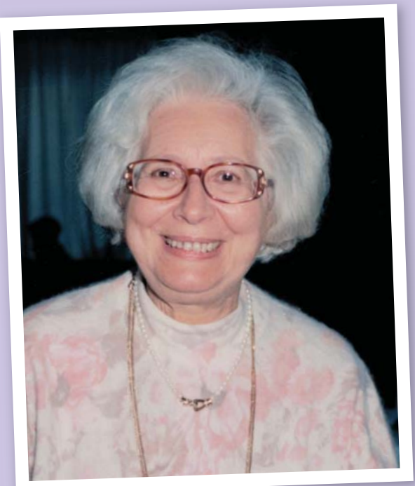
1998, στην κοπή πίτας του ΣΠΕΑ