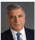
Του Γιώργου Πατούλη

Ο θάνατος της Τιτίκας Μανδαλάκη-Γιαννιτσιώτη αποτελεί μία πολύ μεγάλη απώλεια για τον επιστημονικό κόσμο.