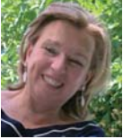
Tns Pénias Γιατηράκν