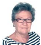
Της Καλλιόπης Λουίζου

Στις 8/4/2020 έφυγε από κοντά μας η ιατρός αιματολόγος Καθηγήτρια Τιτίκα Μανδαλάκη-Γιαννιτσιώτη που η ζωή και το έργο της είχε αφιερωθεί σε δύο μεγάλους τομείς της Ιατρικής Επιστήμης, την οργάνωση της Αιμοδοσίας στη χώρα μας αφ' ενός και τον τομέα των Συγγενών Αιμορραγικών Διαθέσεων αφ' ετέρου.