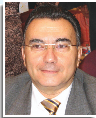
Γιώργος Αρέστης, Μέλος του Ευρωπαϊκού Δικαστηρίου

Η Ευρωπαϊκή Χάρτα για τα Δικαιώματα των Ασθενών ορίζει 14 θεμελιώδη δικαιώματα των Ευρωπαίων πολιτών σχετικά με την υγειονομική περίθαλψη. Η αυξημένη κινητικότητα των πολιτών εντός της ΕΕ δημιουργεί συγκεκριμένα ερωτήματα σχετικά με την εφαρμογή τους στους διακρατικούς ασθενείς. Το στρογγυλό τραπέζι έχει ως στόχο τόσο να διευκρινιστεί ο τρόπος με τον οποίο τα δικαιώματα των διακρατικών ασθενών προστατεύονται σήμερα, όσο και να συζητηθούν πιθανές λύσεις που θα βελτιώναν την υλοποίησή τους.